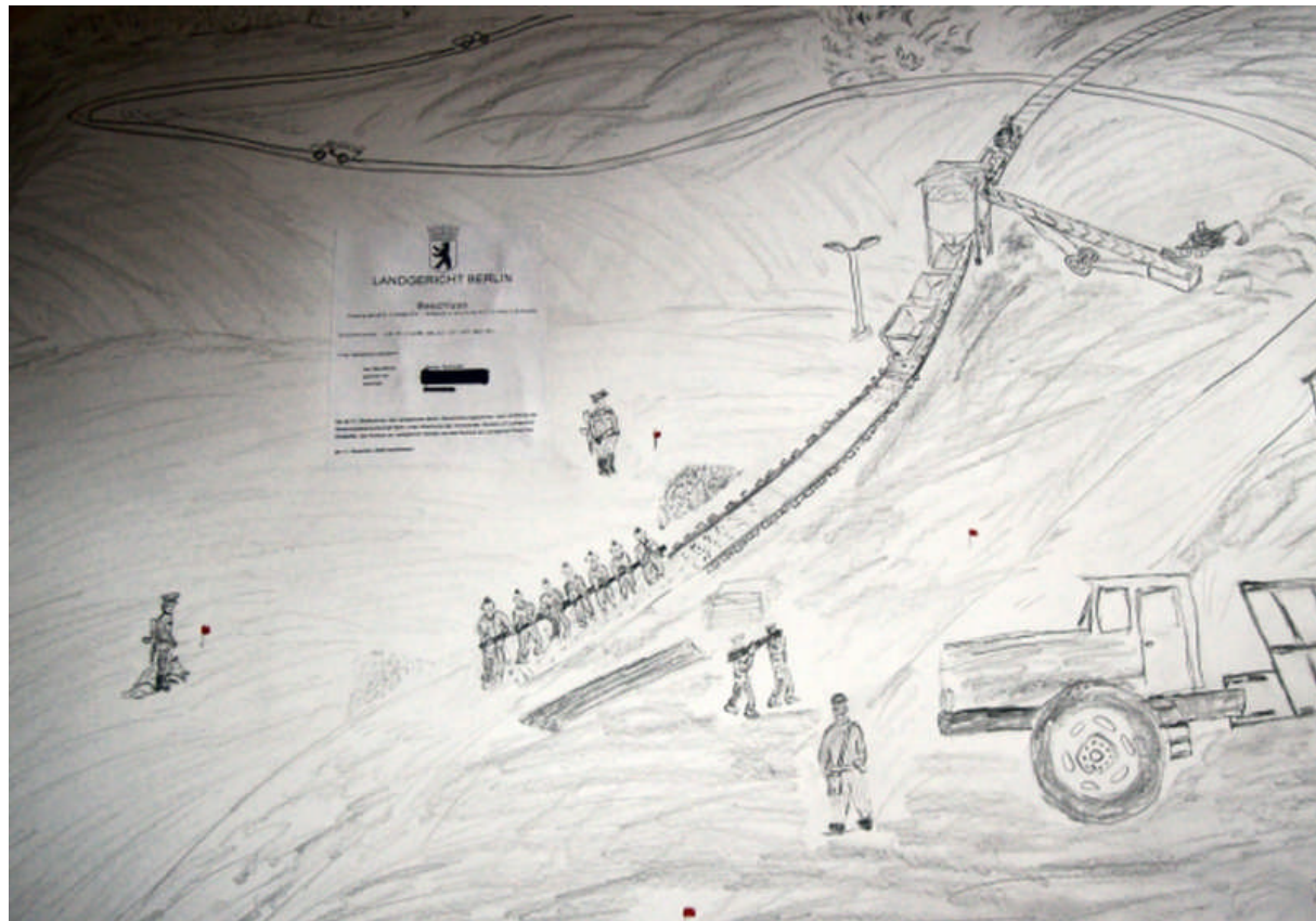
So ist das Bild von Rüdersdorf im Kopf: eine Zeichnung beim Gleisbau.