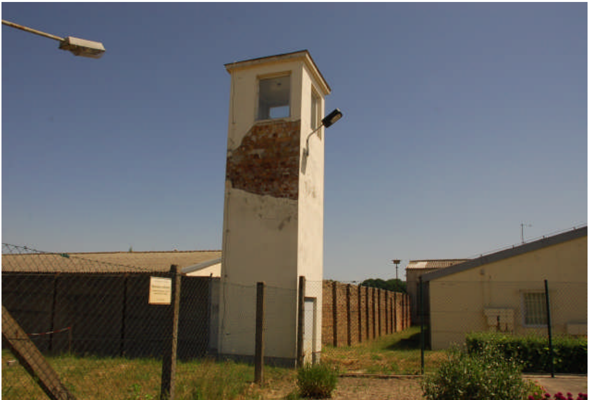
Der Turm erinnert an vergangene harte Zeiten im Berndshof.