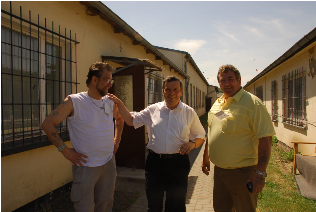
Reise in die Vergangenheit: Wir drei im Juni 2008 in Ueckermünde